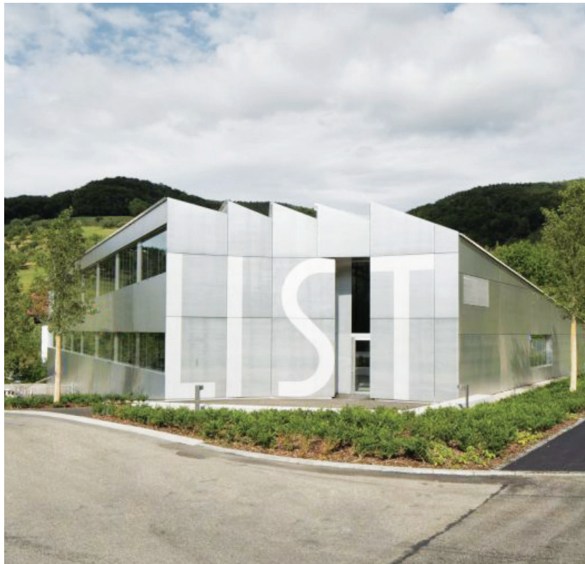
스위스 바젤 인근 아리스도르프 소재 LIST 본사 및 테스트 센터