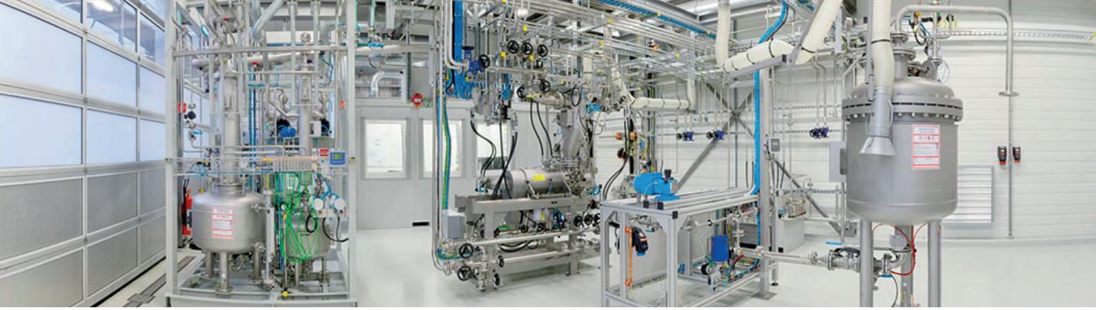
LIST 테스트 센터의 첫번째 베이: 전체적 맞춤형 실험이 가능